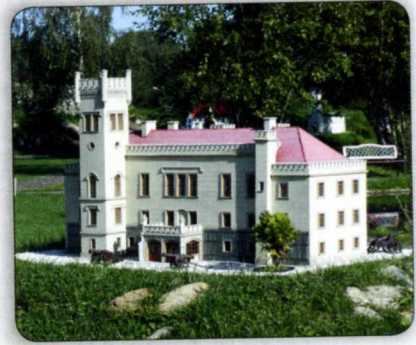
DAS EICHBERGER SCHLOSS