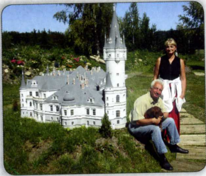
DIE RESIDENZ DER FAMILIE VON MAGNIS ECKENDORF