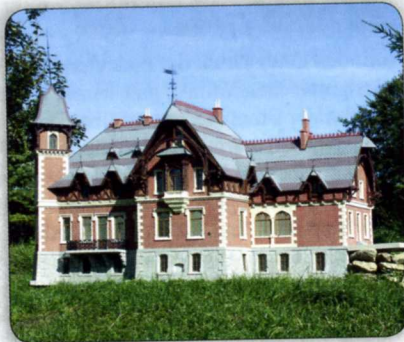
EICHEN SCHLOSS IN FISCHBACH