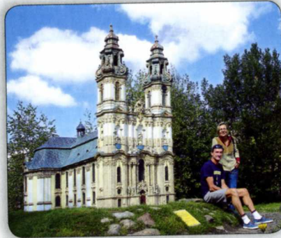
MARIENKIRCHE IN GRÜSSAU