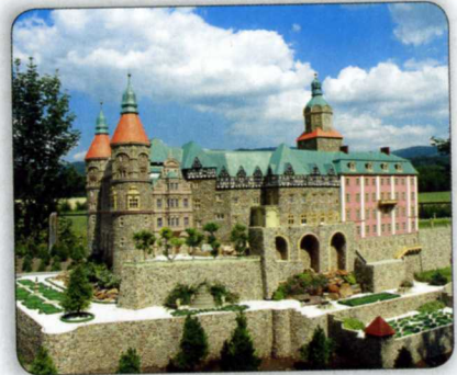
DAS SCHLOSS FÜRSTENSTEIN IN WALDENBURG