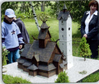
DIE KIRCHE WANG IN KRUMMHÜBEL