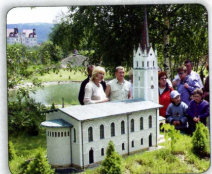
DIE KIRCHE VON FRIEDRICH WILLHELM IV IN ERDMANSDORF