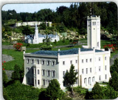
DIE SOMMERRESIDENZ DER PREUSSISCHEN KÖNIGE IN ERDMANSDORF