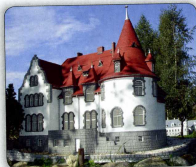
DAS HAUS VON GERHART HAUPTMANN IN AGNETENDORF